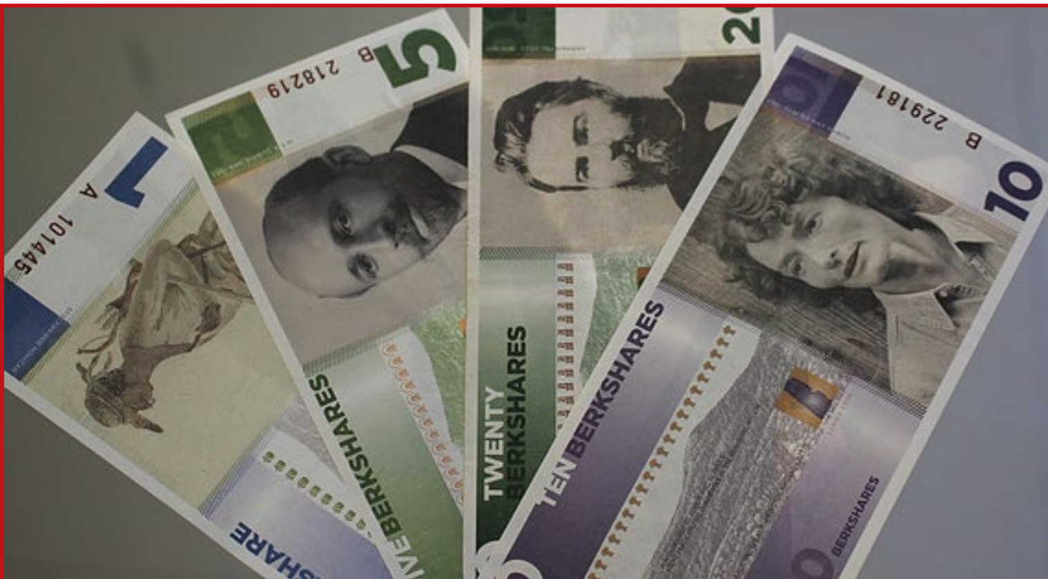
Los billetes de Bershares, en la zona de Berkshires en Massachusetts (EEUU) incluyen imágenes de héroes locales como Herman Melville, autor de Moby Dick (en el billete de 20 Berkshares)

Todos tenemos algo que puede servir o ayudar a otra persona, y viceversa. En este sentido, todos tenemos un potencial de crear riqueza mediante el intercambio, que podemos activar si tenemos un instrumento para hacer ese intercambio.