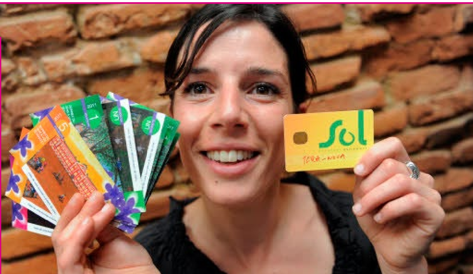
Sol Violette es la moneda ciudadana de la ciudad de Toulouse en Francia y funciona con tarjeta de débito y billetes

Por ejemplo, si Alicia tenía 100 unidades ayer y las transfirió a José hoy, en todos los ordenadores de la red aparecerá que hoy Alicia tiene cero unidades monetarias y José tiene 100 unidades más que ayer.